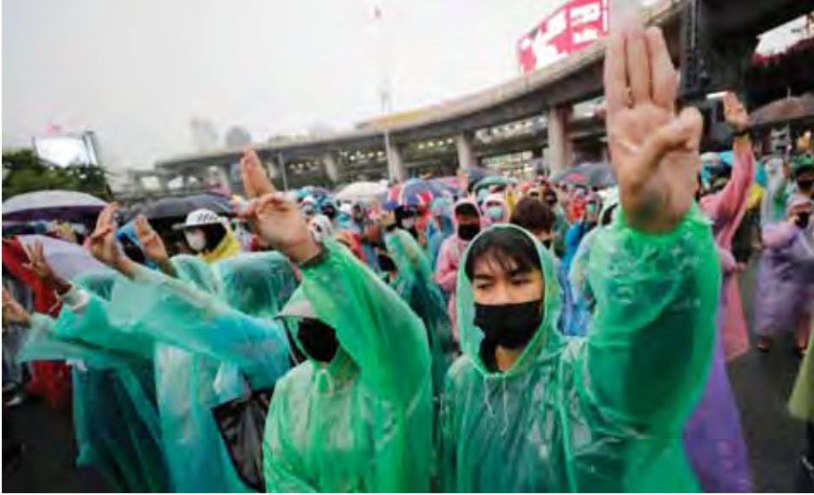
Pro-democracy protesters flash a three-fingered salute during rain at an anti-government protest at Victory Monument during a protest in Bangkok, Thailand on Sunday