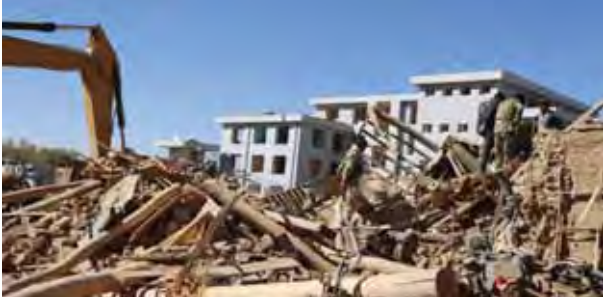
Afghan security inspects the site of a suicide car bombing in Ghor province western of Kabul, Afghanistan on Sunday