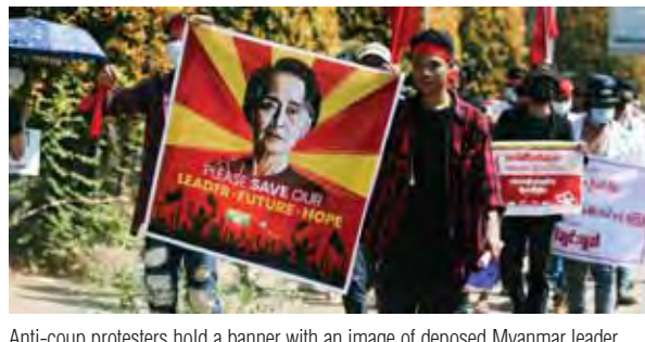
Anti-coup protesters hold a banner with an image of deposed Myanmar leader Aung San Suu Kyi on Saturday

Mass street demonstrations in Myanmar entered their second week Saturday, with neither protesters nor the military government they seek to unseat showing any signs of backing down from confrontations. Protesters in Yangon, the country's biggest city, again congregated at Hleden intersection, a key crossroads from which groups fanned out to other points, including the embassies of the United States and China. They marched despite an order banning gatherings of five or more people. The U.S., especially after President Joe Biden announced sanctions against the military regime, is regarded as an ally in the protesters' struggle against the February 1 coup. China is detested as an ally of the ruling generals, whose